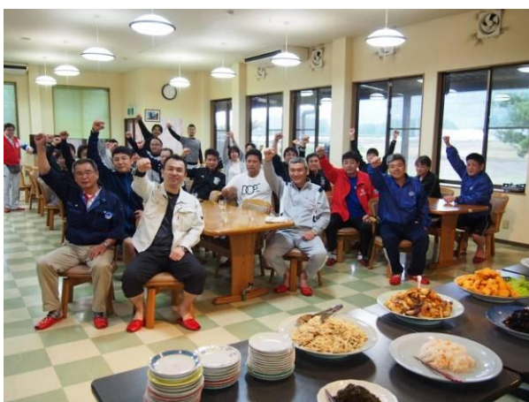
▲食堂で「明日も頑張るぞっ！」