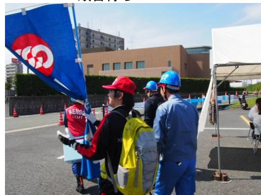
▲▼班ごとに力を合わせて行動