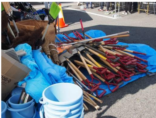
▲ニーズに応じて機材を用意