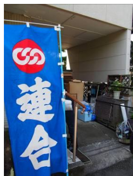
▲作業宅では連合旗を