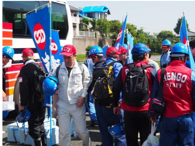
▲ボランティアセンターに到着