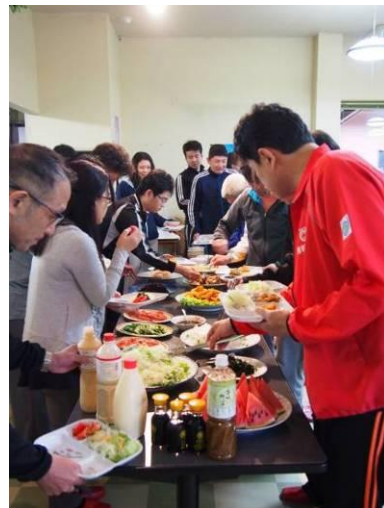
▲食事はバイキング形式