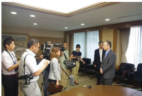
記者会見のもよう→