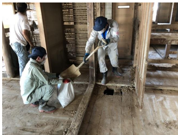
▲屋内に積もった泥を土のうに入れて運び出し