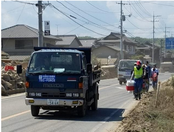
▲埃が舞う中での作業