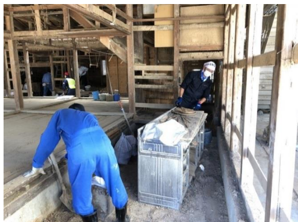
▲キッチンシンクの搬出