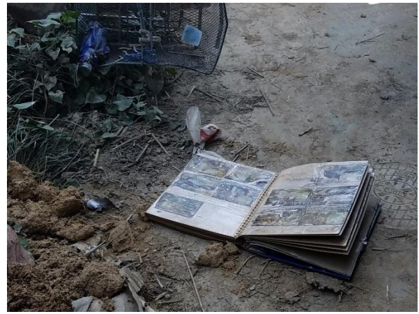
▲思い出の詰まったアルバムを発見 ご家族にお渡ししました