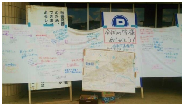
▲真備支所ボランティアセンターの掲示板