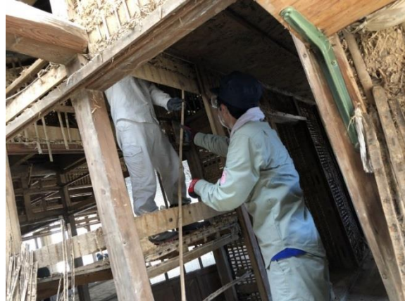
▲足場が不安定な中、建材を剥がす作業