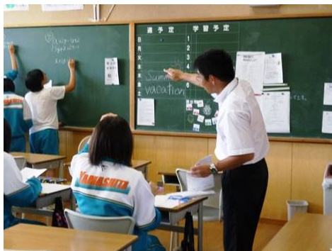
↑生徒たちへ学習支援するボランティア先生！

宮古市、大槌町、山田町、岩泉町、陸前高田市などにある8校に対し、学習支援補助、図書整理、備品整理、草取り、地区陸上大会のお手伝いなどを実施しました。