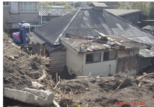
被害にあった住宅