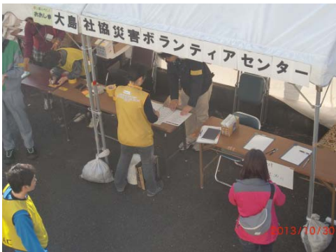
大島ボラセンでまず登録

連合東京が各構成組織へ被害状況調査を実施した結果、家屋の床上浸水や事務所への土砂流入、車の流出等の被害がありました。組合員やご家族への人的被害はありませんでした。また連合東京は10月29～30日に現地へ入り、被災状況を調査するとともに、ボランティアセンターおよび関係者とボランティア活動について綿密な打合せを行い、11月6日から第1陣を派遣し、12月21日まで3泊4日～4泊5日で13団、65名を派遣することとなりました。活動内容は、家屋に流入した泥出しや、土のう積み、また食事は自炊ということで、連合東京ボランティア団は現地で懸命に活動しています。これから益々寒くなりますが、くれぐれも安全第一でお願いいたします。