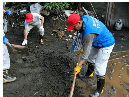
水を含んだ火山灰は腰にくる

本ニュースは、全国の皆さんの声をベースに発行していきます。「こんな取り組みしているよ」「今、現地はこうなっている」などの声や写真をぜひお寄せください。お待ちしております！