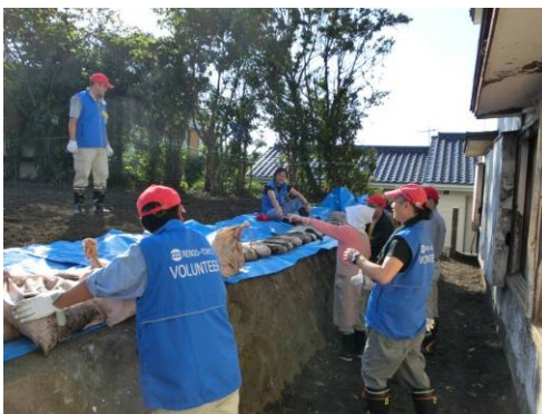
土のうを積み上げ土砂をシャットアウト