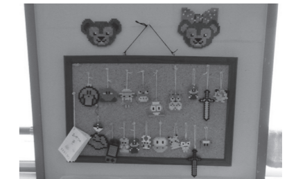
学童保育室の風景